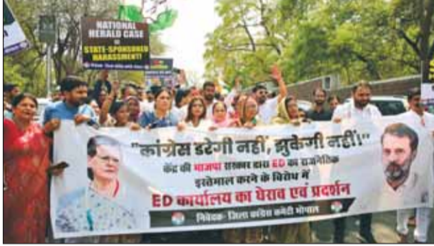
कांग्रेस इटेंगी नहीं, झुकेगी नहीं! काँग्रेस पार्टी का एक प्रमुख कार्यक्रम है।

नेशनल हेराल्ड और एसोसिएट ट्रेड जर्नल्स लिमिटेड से जुड़े मनी लॉन्ड्रिंग केस में प्रवर्तन निदेशालय द्वारा मंगलवार को चार्जशीट दाखिल करने के बाद से सियासत फिर गर्मा गर्मा गई। चार्जशीट में सोनिया गांधी, राहुल गांधी के नाम शामिल किए जाने के विरोध में बुधवार को कांग्रेस ने राजधानी भोपाल सहित प्रदेश भर में प्रदर्शन किया। कांग्रेस ने भोपाल में ईडी दफ्तर के बाहर विरोध प्रदर्शन किया।