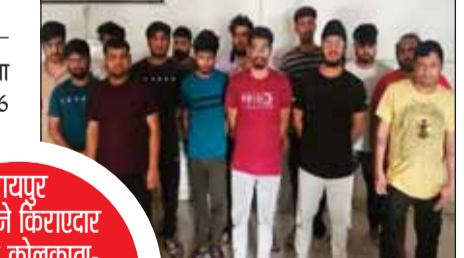
रायपुर पुलिस ने किराएदार बनकर कोलकाता-गुवाहाटी में छापे मारे, 500 अकाउंट से करोड़ों का ट्रान्जेक्शन बनकर फ्लैट देखने के बहाने अंदर घुसे थे। इनमें झारखंड के 3, मध्यप्रदेश के 2, पंजाब-उत्तरप्रदेश-बिहार का एक-एक, छत्तीसगढ़ के 6 आरोपी शामिल हैं।

रायपुर पुलिस की टीम ने पश्चिम बंगाल के कोलकाता और असम के गुवाहाटी में छापेमारी की। इस दौरान 6 राज्यों के 14 सटोरियों को गिरफ्तार किया। यह सभी आरोपी महादेव सट्टा ऐप के पैनल से IPL में सट्टा खिला रहे थे। 500 बैंक खातों से करोड़ों के लेन-देन के सबूत मिले हैं। रायपुर क्राइम ब्रांच ने आरोपियों के पास से करीब 30 लाख रुपए का मोबाइल, लैपटॉप और अन्य इलेक्ट्रॉनिक सामान जब्त किया है। रेड करने के लिए पुलिसकर्मी खुद किराएदार