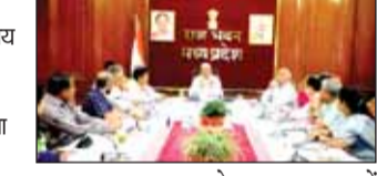
राज्यपाल पटेल राजभवन में जनजातीय प्रकोष्ठ के तत्वावधान में आयोजित समीक्षा बैठक की अध्यक्षता कर रहे थे।

राज्यपाल मंगुभाई पटेल ने कहा कि सिकल सेल उन्मूलन प्रयासों में जेनेटिक काउंसलिंग की भूमिका बहुत महत्वपूर्ण है। जेनेटिक काउंसलिंग कार्यों में मध्यस्थों की भूमिका की संभावनाओं पर कार्य करते हुए समुदाय का सहयोग प्राप्त किया जाए। उन्होंने कहा कि सिकल सेल एनीमिया आनुवंशिक रोग है। रोग को खत्म करने के लिए वैवाहिक और गर्भधारण संबंधी सावधानियां के बारे में सामुदायिक जन जागृति की दिशा में प्रभावी पहल जरूरी है। जेनेटिक काउंसलिंग कार्य में समुदाय के नेतृत्व और पंचायत पदाधिकारियों का सहयोग भी लिया जाना चाहिए।