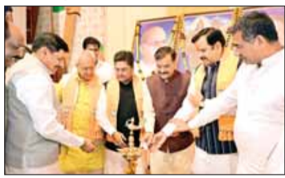
मुख्यमंत्री डॉ. मोहन यादव ने कहा कि कांग्रेस की चमड़ी बहुत मोटी हो गई है। बाबा साहब डॉ. भीमराव अंबेडकर का सबसे ज्यादा अपमान करने का काम अगर किसी ने किया है तो वह देश पर सबसे ज्यादा समय तक राज करने वाली कांग्रेस पार्टी है। कांग्रेस ने संविधान में एक-दो बार नहीं, बल्कि अपनी जरूरतों के हिसाब से अनेकों संशोधन करने का काम किया। अब जब नेशनल हेराल्ड केस में कांग्रेस नेताओं पर चार्जशीट दाखिल हुई, तो इंडी के दफ्तरों के बाहर प्रदर्शन किया जा रहा है। क्या कांग्रेस

कांग्रेस का मूल चरित्र ही तुष्टिकरण और काम निकालने का रहा है: डॉ. यादव